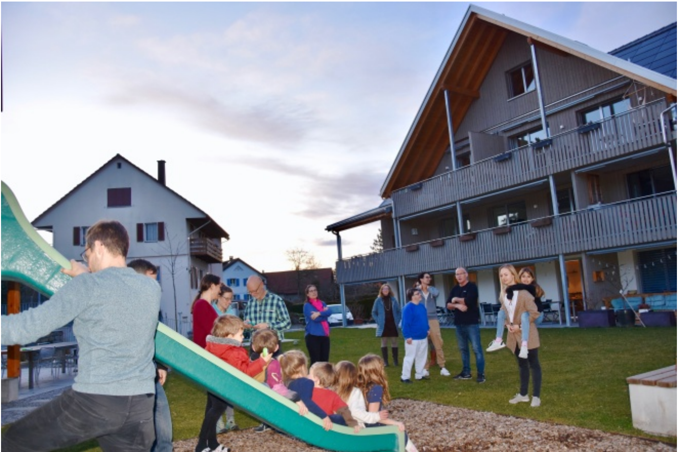
Das Open House in Pfäffikon ZH