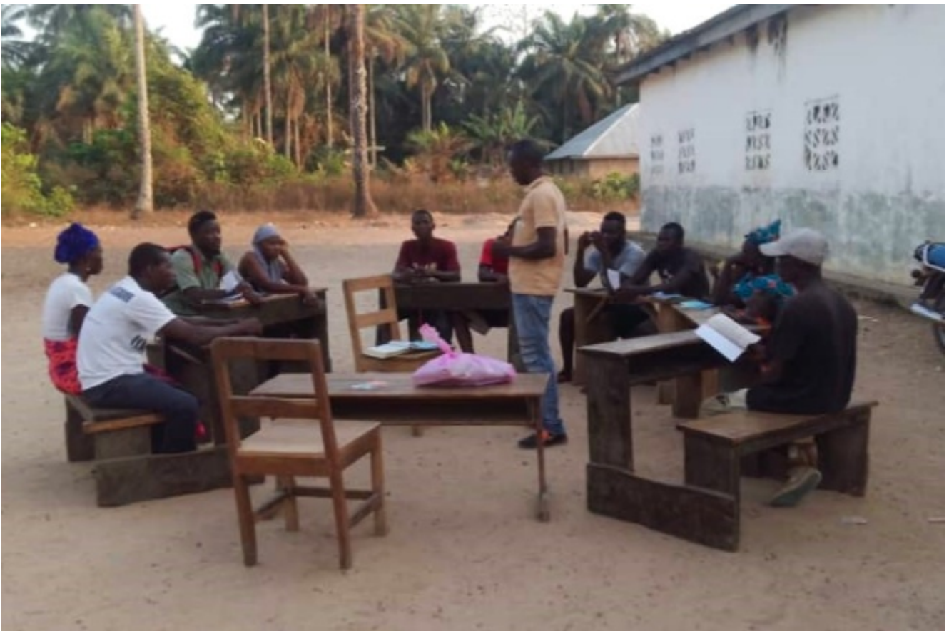
Kleingruppe in Sierra Leone

Im laufenden Jahr konnten 85'000 Christen mobilisiert werden, 468 Gemeinden waren aktiv. Insgesamt wurden 200'000 Traktate verteilt, 13'522 Menschen fanden zu Jesus und 553 Personen wurden getauft.